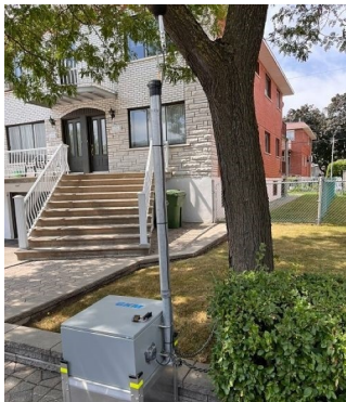
Point de mesure P2