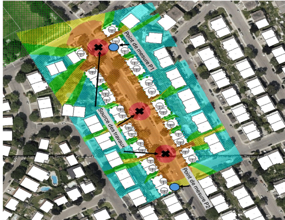
Résultats des calculs de niveau sonore LA10, représenté par des surfaces isophones, illustrant les travaux situés à différents endroits (position 1,2 et 3)