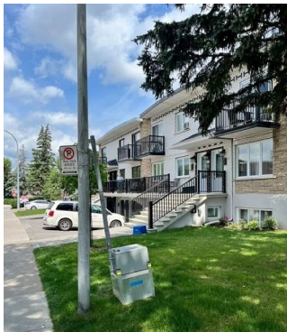
Point de mesure P1

Le projet porte sur la conduite d'eau principale et les travaux de voirie dans la rue Albanel, entre la rue de Coutances et la rue Belherbe à Montréal. GKM Consultants a été mandaté par Eurovia pour réaliser un suivi du bruit durant les travaux. Un programme détaillé de contrôle acoustique, qui comprend un plan de suivi et un programme général a été réalisé.